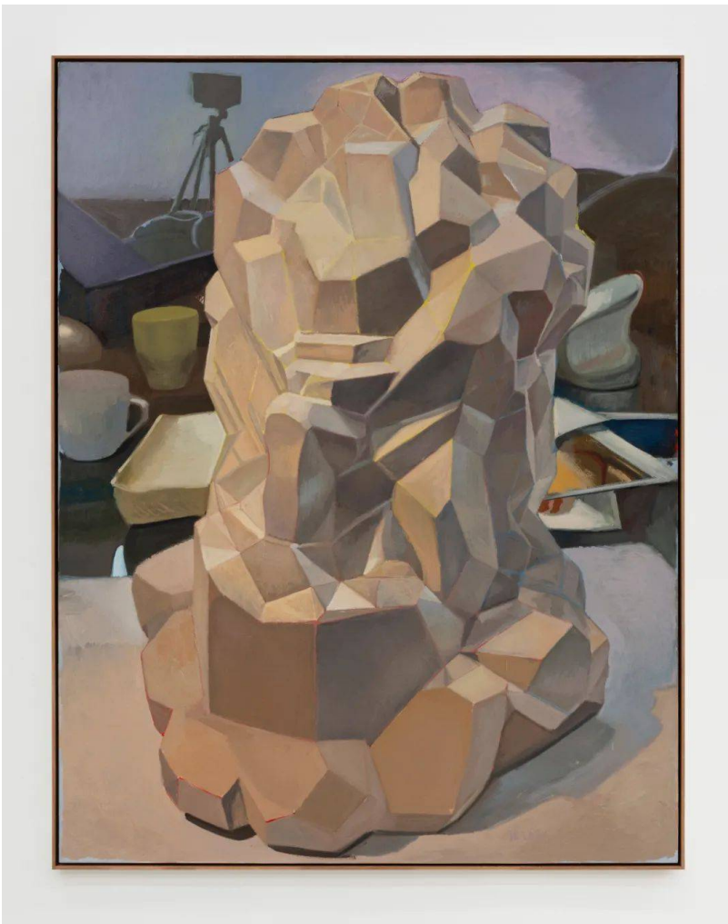
《建筑（摩西）》布面油画 264×204cm2020