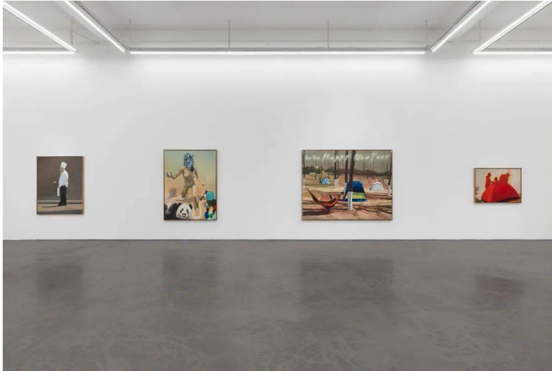
“中东铁路：张慧”长征空间展览现场

动身之前，查阅了一些由从事历史研究的亲戚推荐的文字资料，对东北的好奇心就更强烈了。