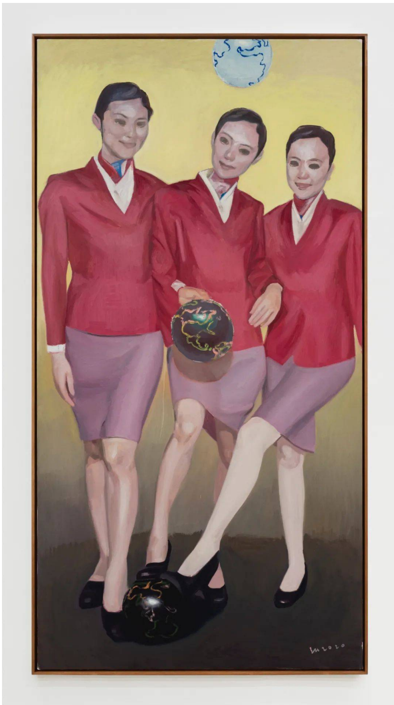
《航线图》 布面油画 250x130cm2020

798艺术： 事实上，在此次展出的作品中还可以看到很多你对自身不同时期创作思考及具体实践方式的引用。你是如何想到将它们选择性地安置、运用于这些从现实提取而来的不同素材之中的？