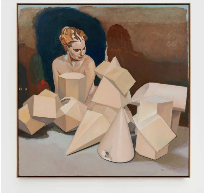
《建筑（几何卡秋莎）》布面油画 204×204cm2020