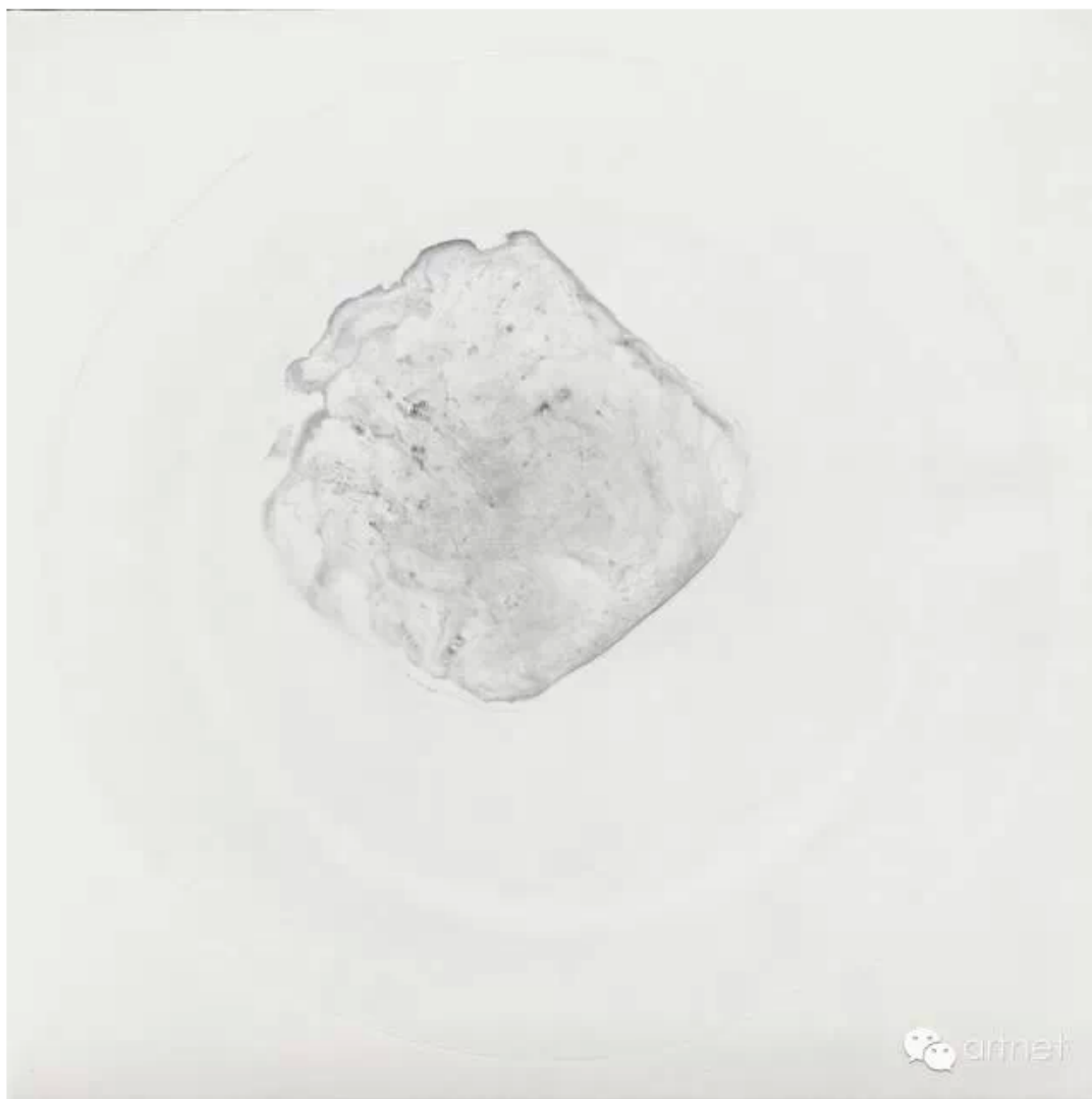
朱昱，《心渍3》，布面油画，150×150 cm，2012

有证据表明，展览“隔离”的现场也经过了打磨，之前的新闻通稿发布的展览方案在开幕前突然修改，原定于在展墙上亦呈线性在画作对面墙上展示的策展人秦思源的文字不见了，甚至都没有出现在展览标题墙上，调整后的策展方案为展览作品留出了大片的白，这种留白，从而让人更好地感知观看对象的策展方案与朱昱的单个绘画本身形成了鲜明的同构关系——他先将画布刷白，一层层地刷，而画布中间可以看到，在层层的白下面掩盖着涂黑了的形状，这黑的形状最初是餐盘，然后是茶碗，再后来是鸡蛋的形状，再后来就只是一块突出对象——那些“剩”和“渍”——的观看域罢了，无所谓形，无所谓图像，从而去抵达一种“空性”。