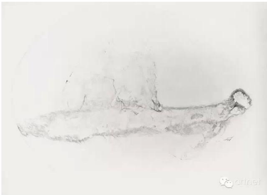
朱昱，《痕迹 E.009》，布面油画，120×100 cm，2014年

朱昱的艺术家形象难道真的是分裂的吗？其实展览“隔离”已经给出了答案。事实上，无论是画“剩餐”、“茶渍”、“石子”还是画“痕迹”，时间的流逝一直是艺术家的核心关注。“剩”的概念里包含着一个物或者生命体的离去，这是一个持续的时间事件，“剩”或“渍”实际都是逝去之物在我们的记忆中的持留，这便是典型的胡塞尔定义的现象学的时间，从这个角度而言，经受了风化打磨而成的“石子”凝聚着时间的流逝，而“尸骸”又何尝不是一个离去之物的“剩”与“渍”呢？朱昱的个人宗教或哲学依然延续着对生命问题的沉思，只是沉思的对象变成了日常唾手可得之物，在这里，艺术家的形象保持了高度统一。