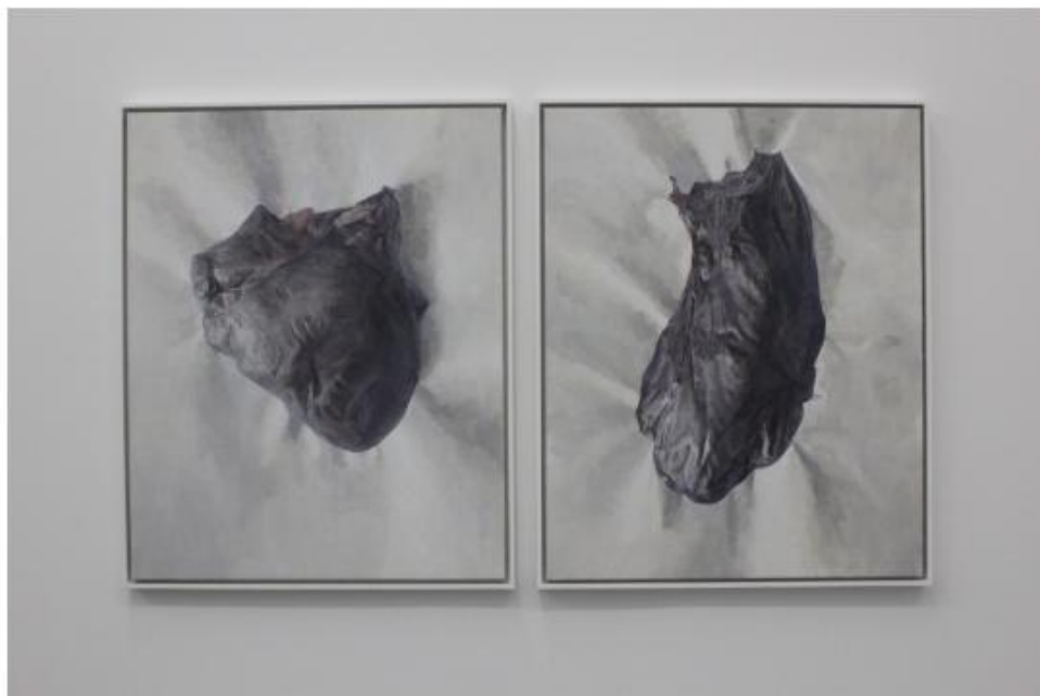
观展终点，两件与小展厅中作品“气质”不同的作品，像是肝脏器官

展览持续到5月24日。此外，长征空间将有朱昱2014年油画作品《茶渍》在本届香港巴塞尔展示。