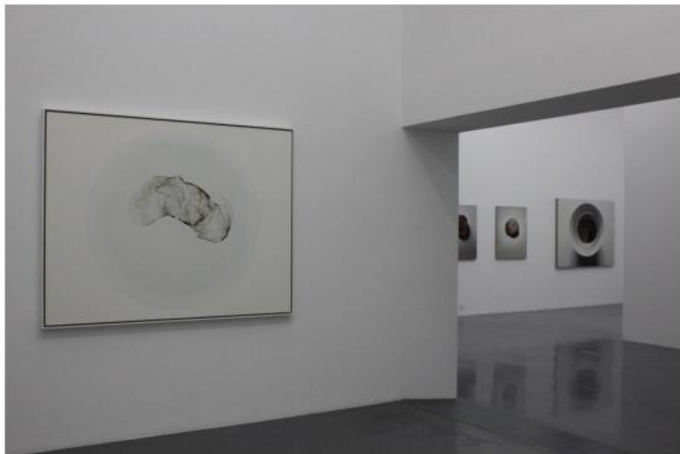
《茶渍》系列，随着观展路线可发现朱昱作品画面中的变化