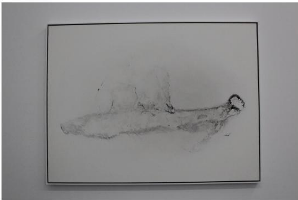
作品画面愈加抽象虚无