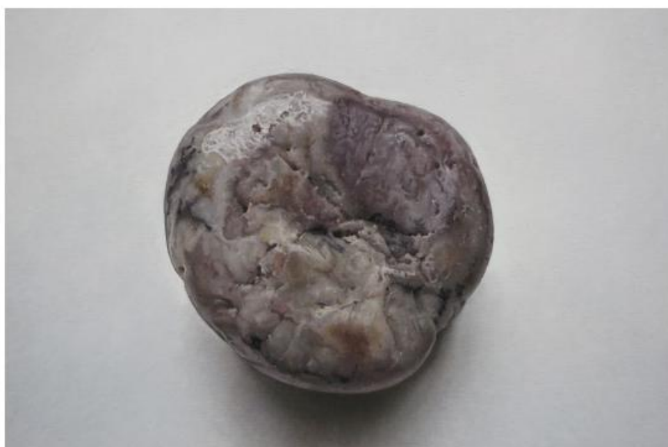
作品细节，一粒石头被无限放大，见微知著