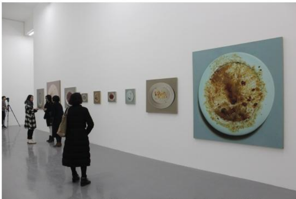
《剩餐》系列第一件作品创作于2003年，为时半年，“隔离”从此件作品开始

十年，是朱昱在不断剔除、削薄、简化、提纯艺术创作的十年。从布展方式也可见端倪，策展人秦思源阐释，整个展览与时间紧密关联，跟踪记录下的是朱昱的创作方式及工作方法，生命即是时间与历程。策展人与艺术家用一年的时间多轮探讨方案，最终作品没有标签、另一面的墙大面积留白没有前言及一点阐释性文字。“去掉没有必要的东西，不要废话，不断做减法。这正像朱昱的创作方式——不留余地，纯粹，哪怕被误解。”