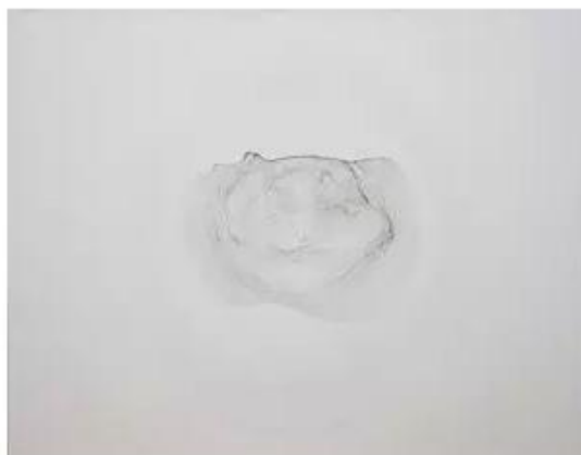
朱昱参展本届香港巴塞尔艺博会作品《茶渍 T24》，2014，布面油画

展览持续到5月24日。此外，长征空间将有朱昱2014年油画作品《茶渍》在本届香港巴塞尔展示。