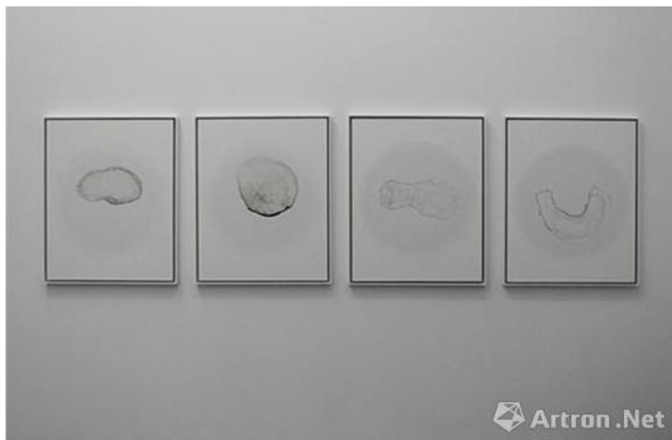
朱昱《茶渍系列》©李靖越